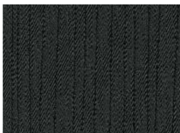
Acenta & N-Connecta Black – auduma apdare