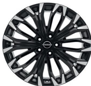
Tekna & N-Connecta 19" ar dimantu slīpēti vieglmetāla diski