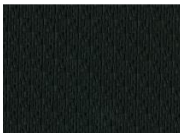
Izvēles aprīkojums N-Connecta Black – PVC ādas apdare