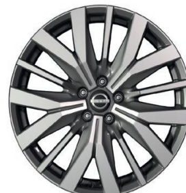
Tekna+ 20" ar dimantu slīpēti vieglmetāla diski