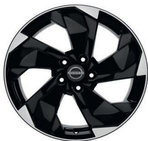
Acenta & N-Connecta 18" vieglmetāla diski